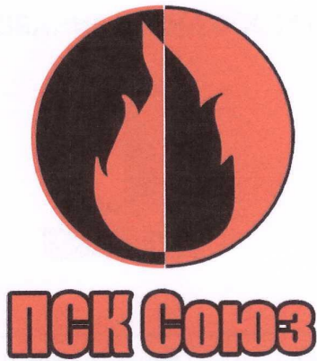
Рис.1 Цветной вариант